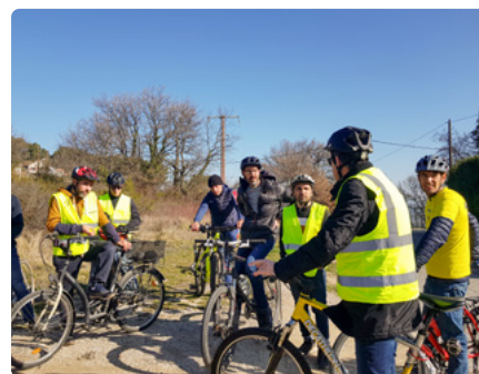
Atelier – Plan vélo Venelles 2023

Des balades urbaines peuvent venir compléter le diagnostic ou conforter les propositions d'itinéraire. Elles peuvent concerner l'équipe projet (élus, techniciens...) ou être ouvertes à l'ensemble de la population, ce qui permet de confronter les points de vue en matière d'appréhension, d'insécurité et de qualité.