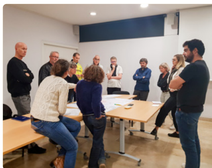
Atelier – Plan vélo Le Puy-Sainte-Réparate 2022