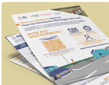
Questionnaire – Plan de mobilités douces Pays de Forcalquier 2023

La mise en place d'un questionnaire auprès des habitants permet de faire remonter leurs besoins et les problématiques qu'ils rencontrent dans leurs déplacements quotidiens. Le questionnaire permet également de les faire réagir sur des premières pistes d'action.